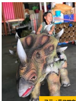
スティラコサウルス